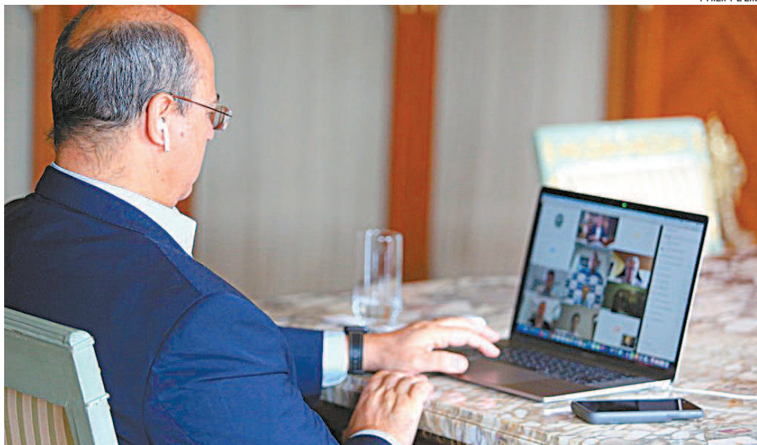
Witzel se encontrou em março com chefes dos Poderes, no Palácio Guanabara, e agora faz reuniões virtuais